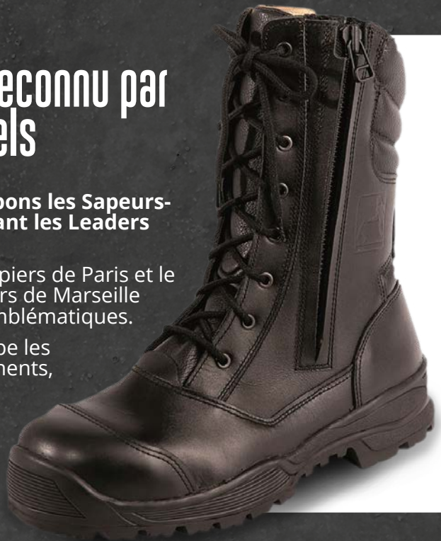
Double fermeture pour les Rangers Sapeurs Pompiers

Les experts utilisent et recommandent nos produits. Les services départementaux d'incendie et de secours nous font confiance depuis de nombreuses années.