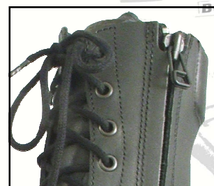
2 Zip latéraux

TIGE Cuir fleur noir 2,2 ± 0,2mm , Ignifugé et traité hydrofuge.