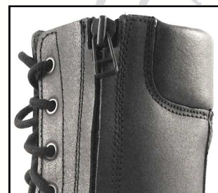
Matelassage haut de col